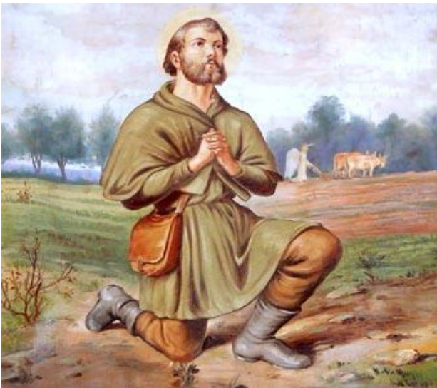
SAN ISIDRO LABRADOR